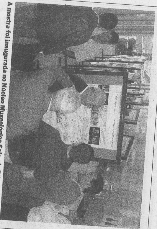
A mostra foi inaugurada no Nucleo Museológico Solar do Ribeirinho.

Actuações nos Açores, continente e na Alemanha (Expo 2000 em Hanóver) e diversas distinções ilustram o percurso da filarmónica madeirense que é uma das instituições antigas do país.