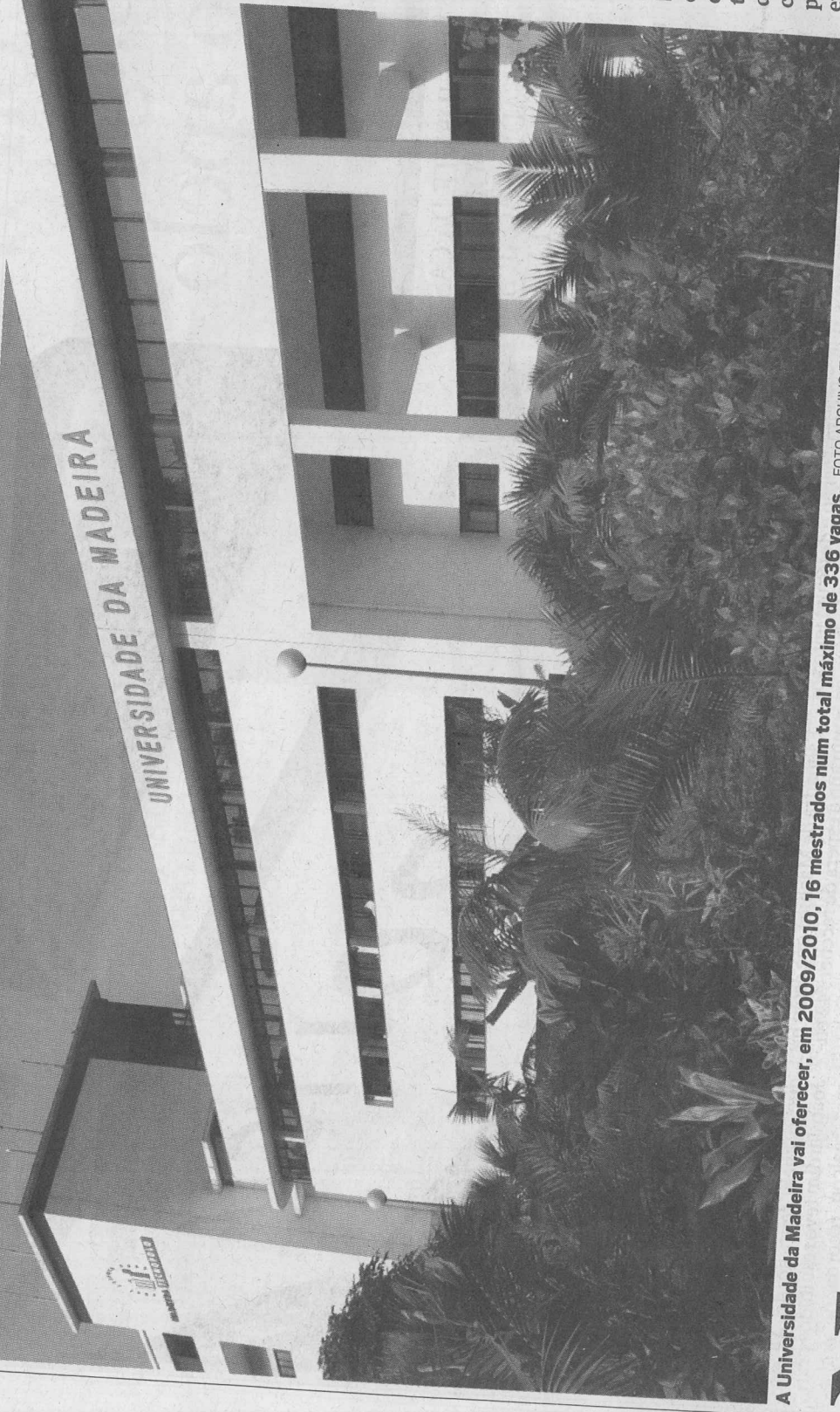
A Universidade da Madeira vai oferecer, em 2009/2010, 16 mestrados num total máximo de 336 vagas.

que seja reconhecido como satisfazendo os objectivos do grau de licenciado pelo órgão científico estatutariamente competente do estabelecimento de ensino superior onde pretendem ser admitidos; ■ Detentores de um currículo escolar, científico ou profissional que seja reconhecido como atestando capacidade para realização deste ciclo de estudos pelo órgão científico estatutariamente competente do estabelecimento de ensino superior onde pretendem ser admitidos.