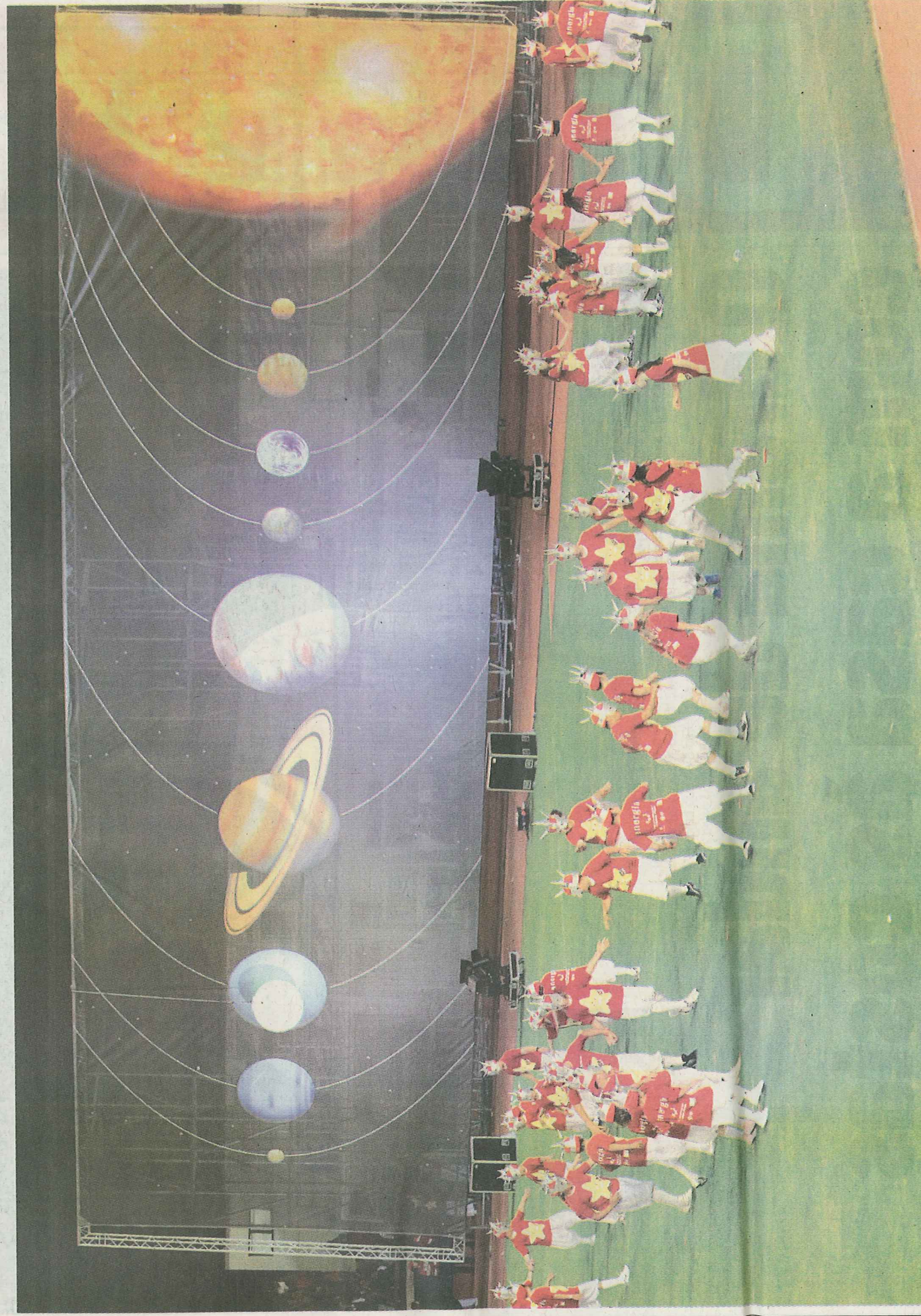
A Terra e o Céu 'tocaram-se' num espectáculo com uma mensagem actual e pedagógica.