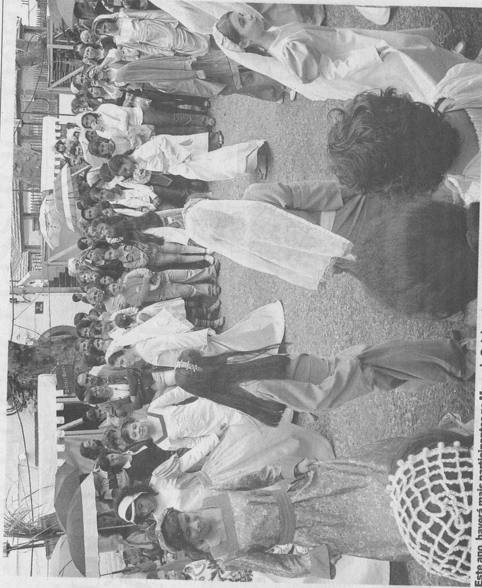
Este ano, haverá mais participantes no Mercado Quinhentista, nomeadamente meio milhar.

O auditório do jardim municipal será palco hoje, a partir das 10h30, do 3.º Encontro Regional da Modalidade Artística de Grupos Instrumentais, promovido pelo GCEA e envolvendo cerca de mil crianças.