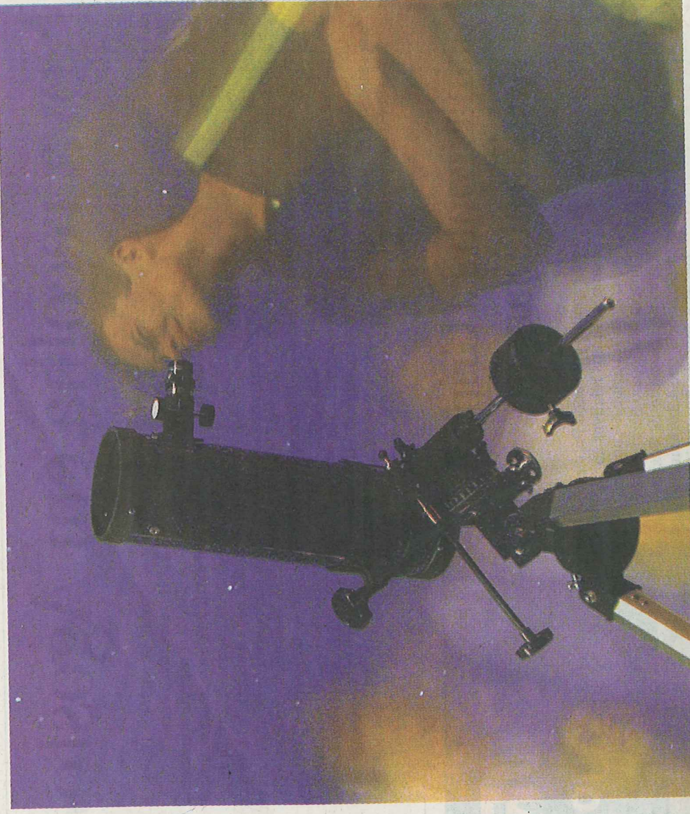
É na área da Astronomia que mais actividades vão ser promovidas ao longo do Verão.

Na área da Geologia, a primeira de três actividades previstas decorre já hoje, com a UMa a promover uma