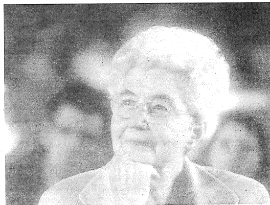
● Chiara Lubich (1920 - 2008), fundadora dos Focolares