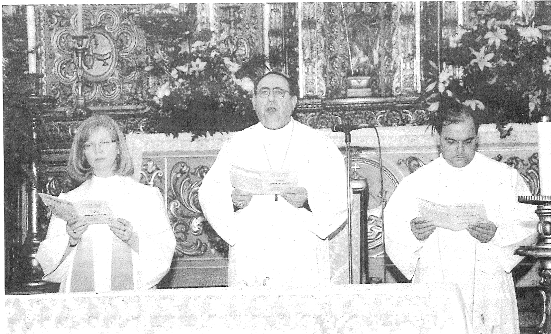
● Igreja de São Pedro acolheu ontem uma celebração ecumênica