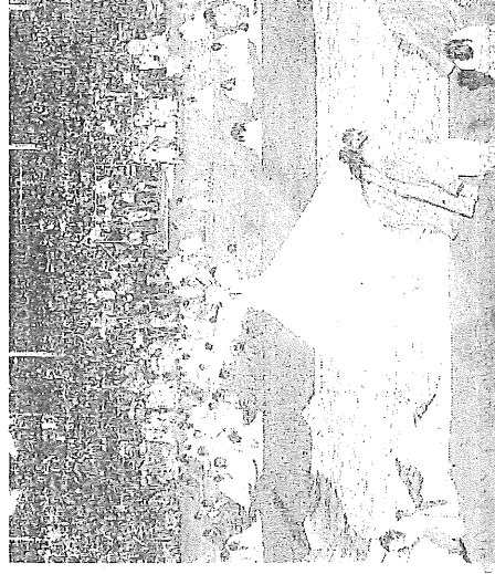
● Várias actividades agendadas para a "Abertura"