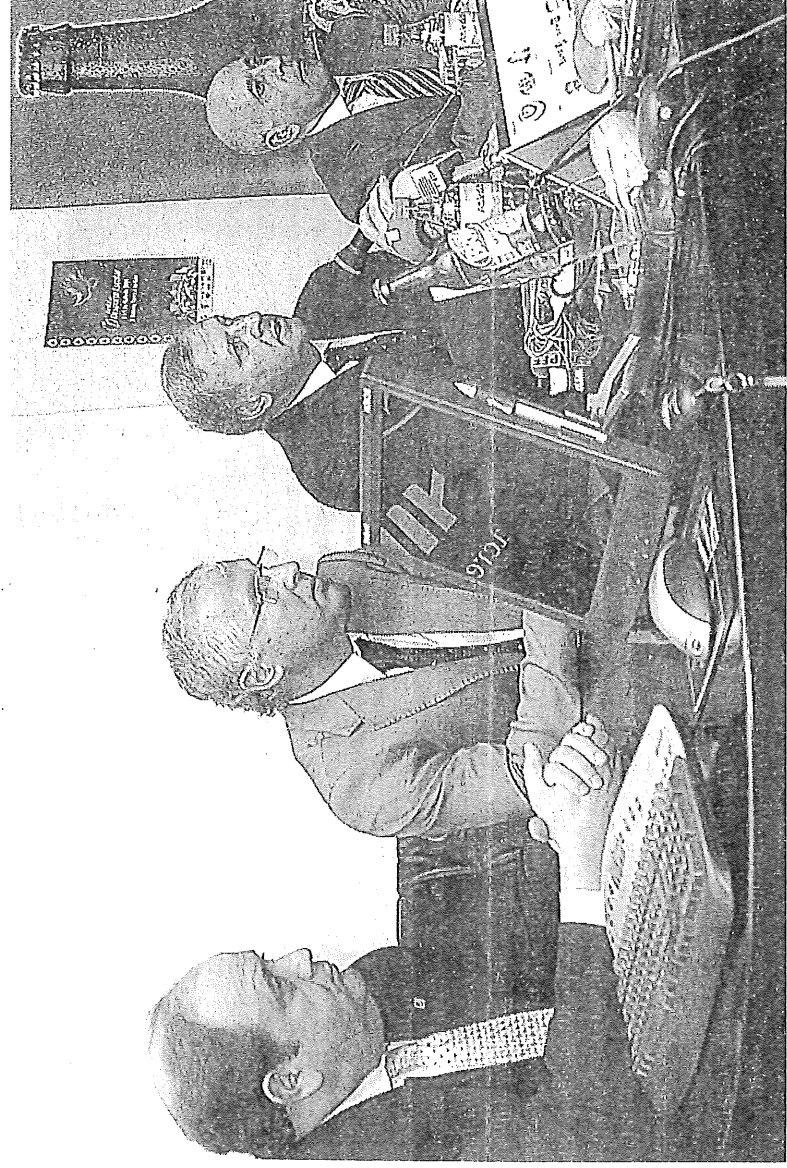
● A festa do Desporto Escolar é já há alguns anos um grande "cartaz" da Madeira na vertente educativa.

Textos: João Paulo Faria • Fotos: Duarte Gomes